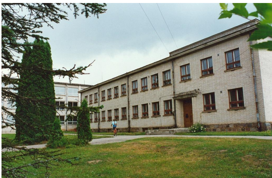
Joonis 1. Abja Gümnaasiumi hoone

Joonisteks nimetatakse kõiki teisi illustratiivse väärtusega materjale, nagu graafikud, diagrammid, skeemid, pildid, fotod, kaardid jne. Joonised on sarnaselt tabelitele nummerdatud ja varustatud seletusega ning neilegi viidatakse tekstis. Erinevus on selles, et joonise number ja seletus asub kohe joonise all, nagu on näha näidiseks toodud joonisel 1.