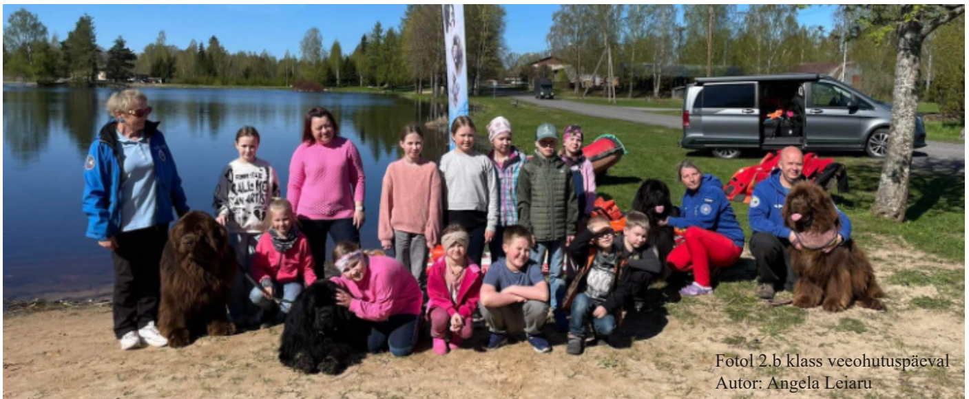
Fotol 2.b klass veeohutuspäeval