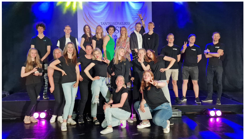
Rise And Dance korraldajad.