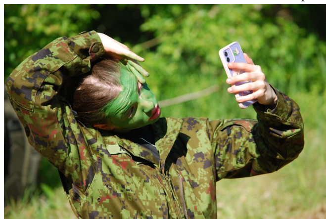
10. klass riigikaitselaagris