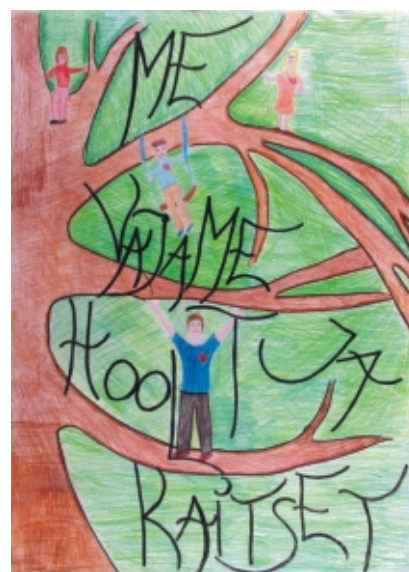
· III koha plakat