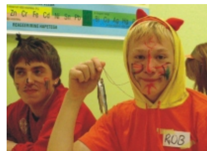
· Igal rebasel peab kala kaelas olema