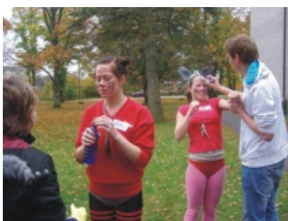
· Rebased said vastavad näod