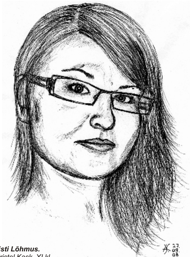
• Õp Christi Lõhmus. Autor: Kristel Kask, XI kl. Karikatuurivõistluse I peauhind.