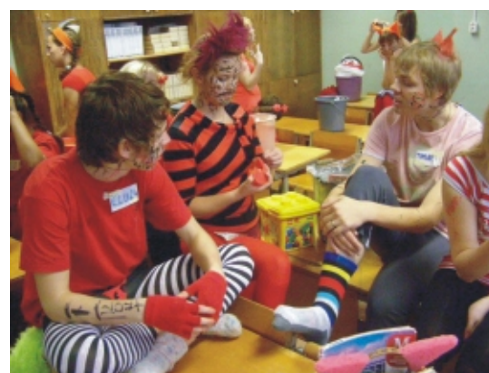
· Rebased lõögastumas