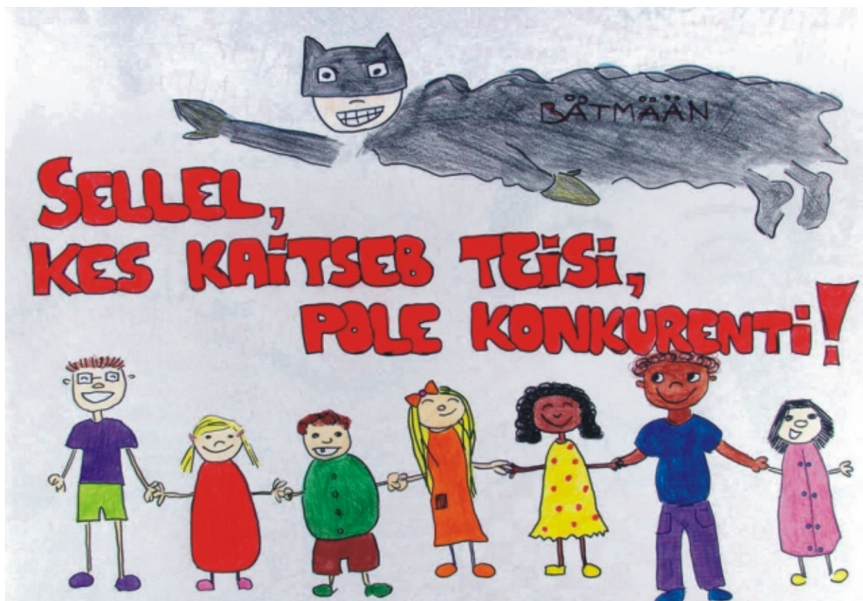
· II koha plakat