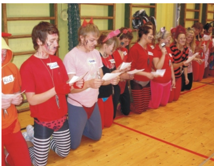
· Korralikud rebased laulavad vanematele ja parematele ülistuslaulu