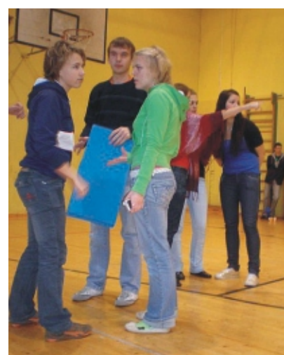
· Vanemad ja targemad plaane tegemas