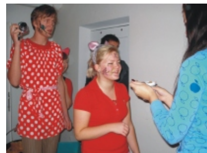
· Kõigepealt sai iga rebane korraliku hommikusöögi