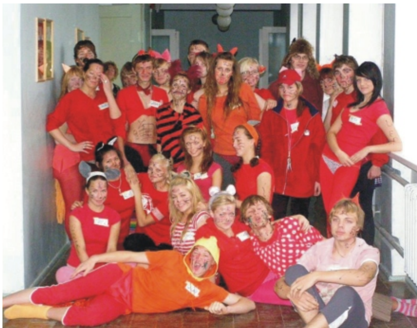
· Meie rebased