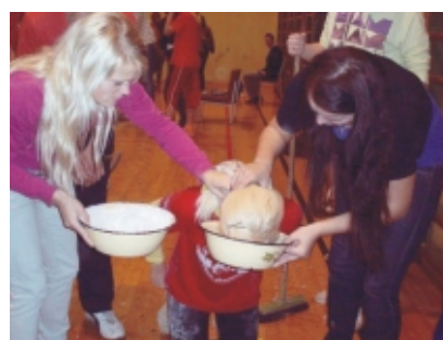
· Lõpetuseks sai iga rebane näo jahuseks teha