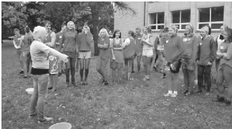
· Külmetavad rebased

Ettevalmistused rebaste ristimiseks algasid nädal enne toimumist, suhteliselt viimasel minutil. Klassiga koos mõtlesime välja üritused ning ülesanded. Kõige esimeseks ülesandeks oligi nuputada rebastele võimalikult raske tee, mida sel päeval läbida. Paari päeva jooksul selgitasime vahetundides toimuvat, kuid mis õigel päeval siiski spontaanselt ümber muudeti.