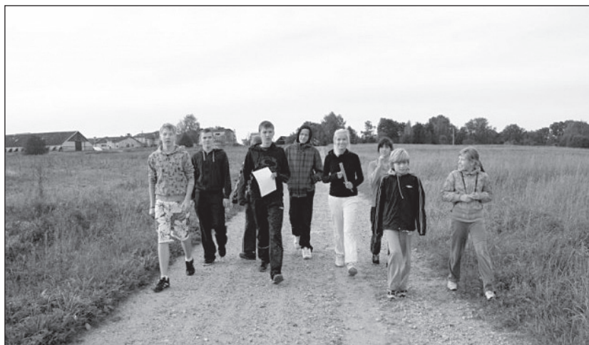
Abja kooli õpilased terviserajal