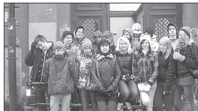
Stockholmis Eesti Kooli ees.

ringi kõndimine oli meid väsitanud. Seejärel hakkasid kõik kruisist viimast võtma, et see reis jääks kauaks meelde. Pidutseti hommikuni, mil olime juba Tallinnasse tagasi jõudnud. Oli tore reis.